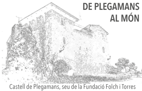
Castell de Plegamans, seu de la Fundació Folch i Torres