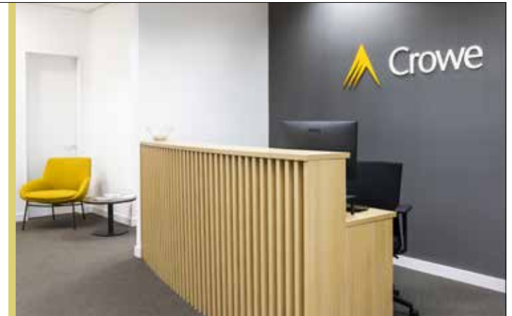
Crowe Accelera Management, S.L. Edifici Realia / Paseo de la Castellana / Madrid Equipament integral de mobiliari i cadres

T. 93 864 81 74 • 650 406 021 • www.jorbachs.com