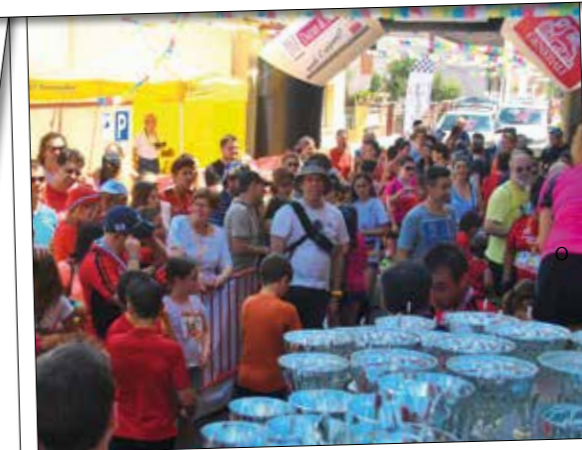
El públic espera l'entrega de trofeus de la 3a Milla Urbana de Sant Pere.