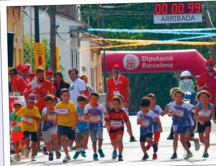
Sortida dels més petits en la cursa del 2022.