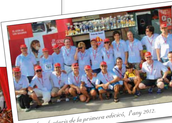
Grup de voluntaris de la primera edició, l'any 2012.

convertint en una gran família que comparteix l'orgull d'haver creat un esdeveniment que avui és referència en l'atletisme català.