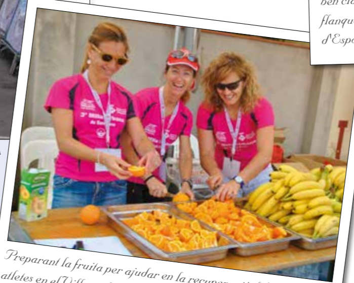
Preparant la fruita per ajudar en la recuperació dels atletes en el Village del 2014.